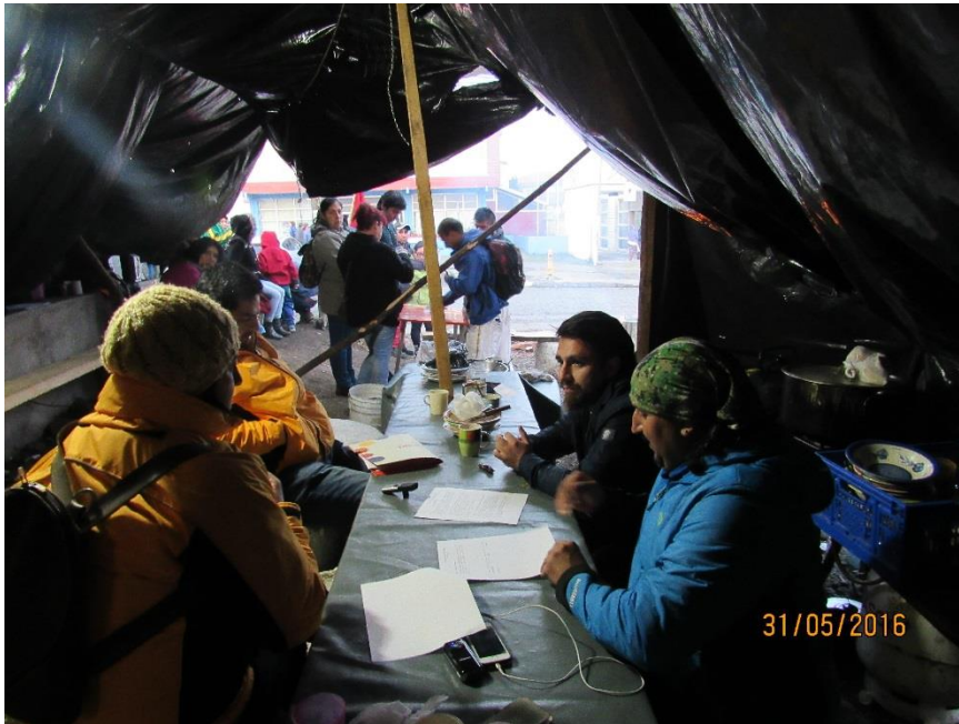
Imagen: Sindicato de trabajadores del Salmon, Quellón, Chiloé