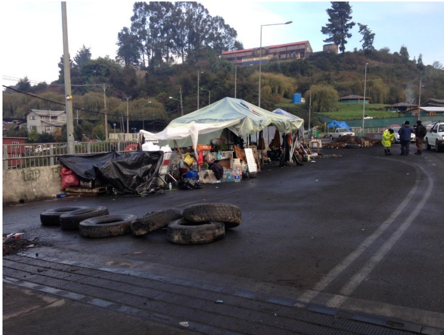
Imagen: Manifestación en Chiloé