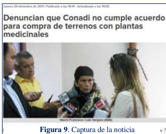
Figura 9. Captura de la noticia

Como podemos observar en la figura 9, se repite el parámetro de los años anteriores, 109 la información no tiene impacto mediático, esta vez sólo