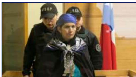
Figura 14.

Por su parte, El Mostrador , muestra una postura crítica de lo que está ocurriendo a través una columna de opinión llamada “La Ley Antiterrorista daña nuestra imagen internacional”, acompañado de una fotografía de la machi, explica de forma enfática que “el problema de fondo en La Araucanía es político y no de seguridad. La violencia que ahí se vive es una consecuencia (y no la causa) de la incapacidad del Estado y los