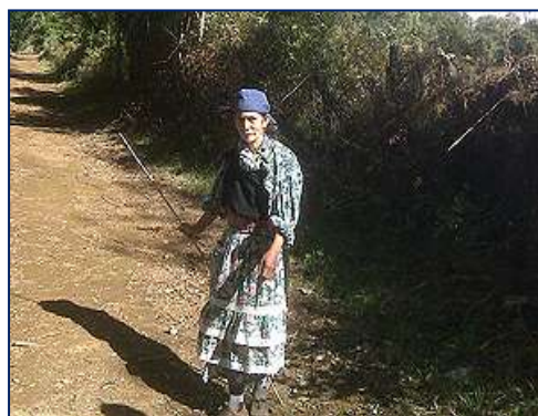
Figura 6. Fotografía de la noticia

Pocos meses después, el 30 de noviembre del 2009 72 , la Corte Suprema falla en favor de la machi 73 , sin embargo, tampoco tuvimos éxito en esta pesquisa. No obstante, destacamos que este acontecimiento sí apareció en el “El Austral- el Diario de la Araucanía”, el cual pertenece a la Sociedad Periodística Araucanía S.A., filial de El Mercurio S.A.P. (perteneciente