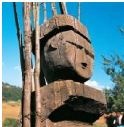
Figura 13. Parte superior de un rehue