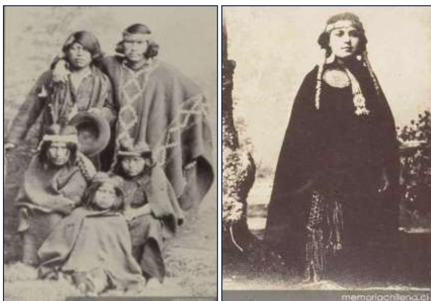
Figura 3. Familia mapuche, hacia 1890 (Izq.). Mujer mapuche luciendo indumentaria tradicional (Der.).

Finalmente, en 1861, el recientemente nombrado Intendente de Arauco, Cornelio Saavedra, propuso un plan de pacificación, o más bien ocupación, el cual estuvo marcado por la violencia y la crueldad, “una de las páginas más negras de la historia de Chile”, en palabras del historiador José Bengoa 41 . Dicho proyecto consistía en construir una línea de fortificación por el río Malleco cambiando la frontera que tradicionalmente llegaba hasta el Bio-Bio. Todo ello significó la invasión del ejército en el territorio mapuche, que como mencionamos anteriormente, había sido declarado autónomo por los españoles. Posterior a esta acción militar, se procedió al reparto de la población indígena en reducciones, distribuidas entre colonos europeos y chilenos. Así, de aproximadamente 10 millones de hectáreas, el Pueblo Mapuche fue reducido a unas 500 mil hectáreas, siendo este el origen de la denominada “deuda histórica”. (Figura 3,4)