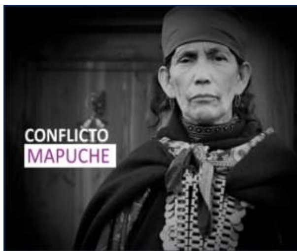
Figura 8. Imagen utilizada en el apartado de la encuesta

Reflejo de la aportación del periodista, es una de las encuestas de Cadem del 2017 93 , la principal empresa de investigación de opinión pública, dedicó un capítulo denominándolo “Conflicto mapuche”, al igual que la prensa, sin considerar al Estado, donde consultaba: