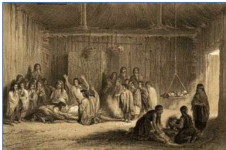
Figura 5. Un machitún, modo de curar los enfermos por Claudio Gay, 1854